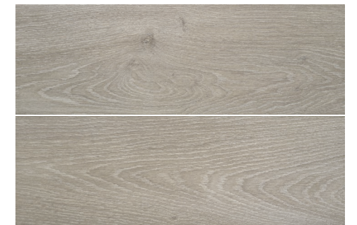
S-Tech Haspe Abedul 20,5x61,5 G2423