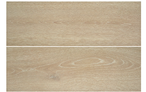
S-Tech Haspe Fresno 20,5x61,5 G2423