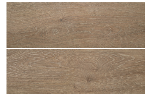
S-Tech Haspe Nogal 20,5x61,5 G2423