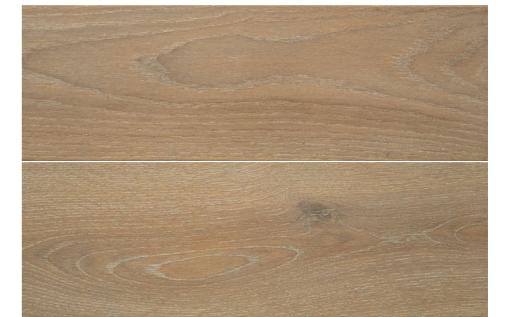
S-Tech Haspe Roble 20,5x61,5 G2423