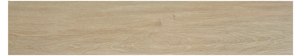
Haspe Fresno 23x120 R