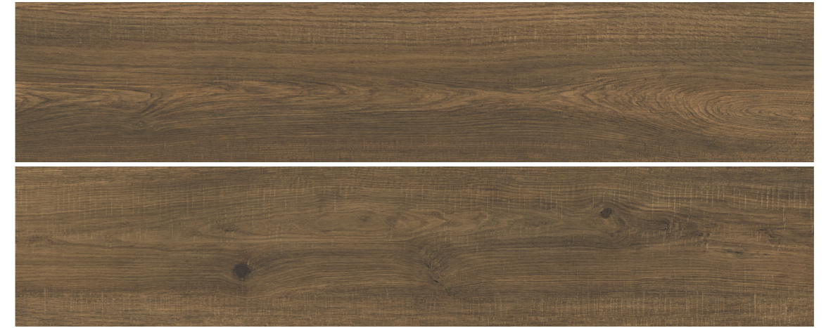
S-Tech Uppsala Nogal 30x150 R