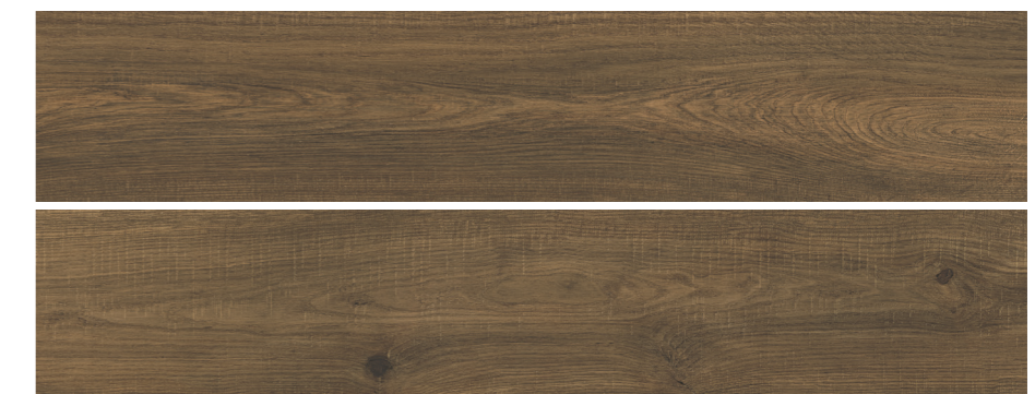
S-Tech Uppsala Nogal 23x120 R