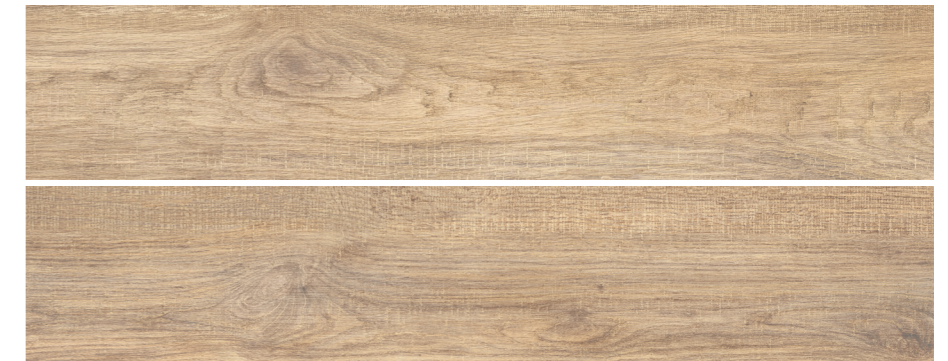
S-Tech Uppsala Natural 23x120 R