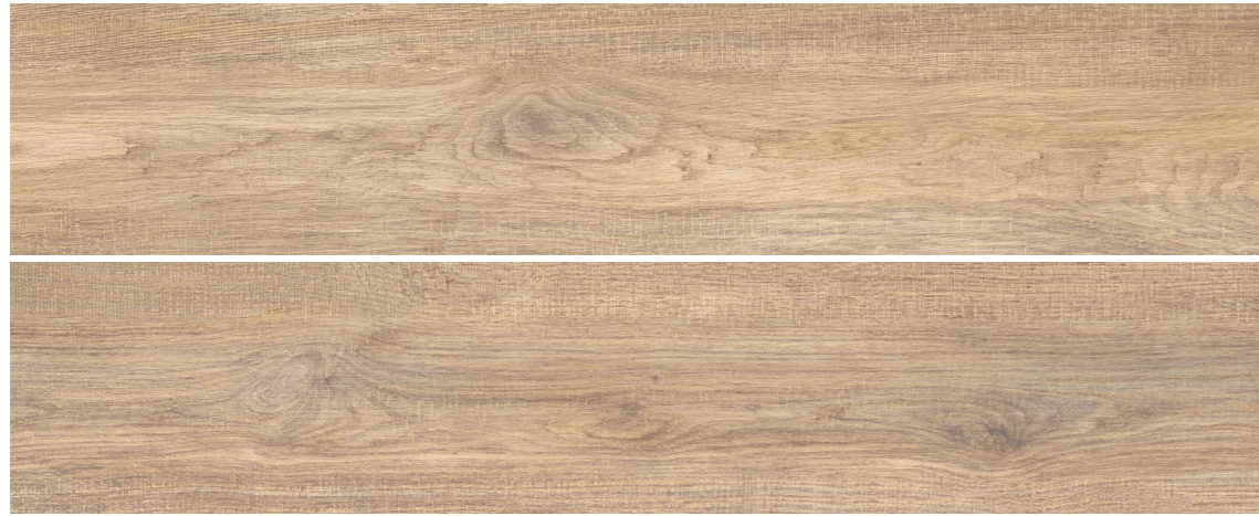
S-Tech Uppsala Natural 30x150 R