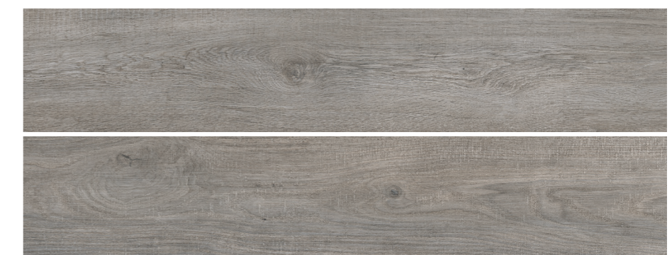
S-Tech Uppsala Greige 23x120 R