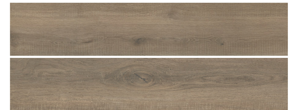
S-Tech Uppsala Taupe 23x120 R