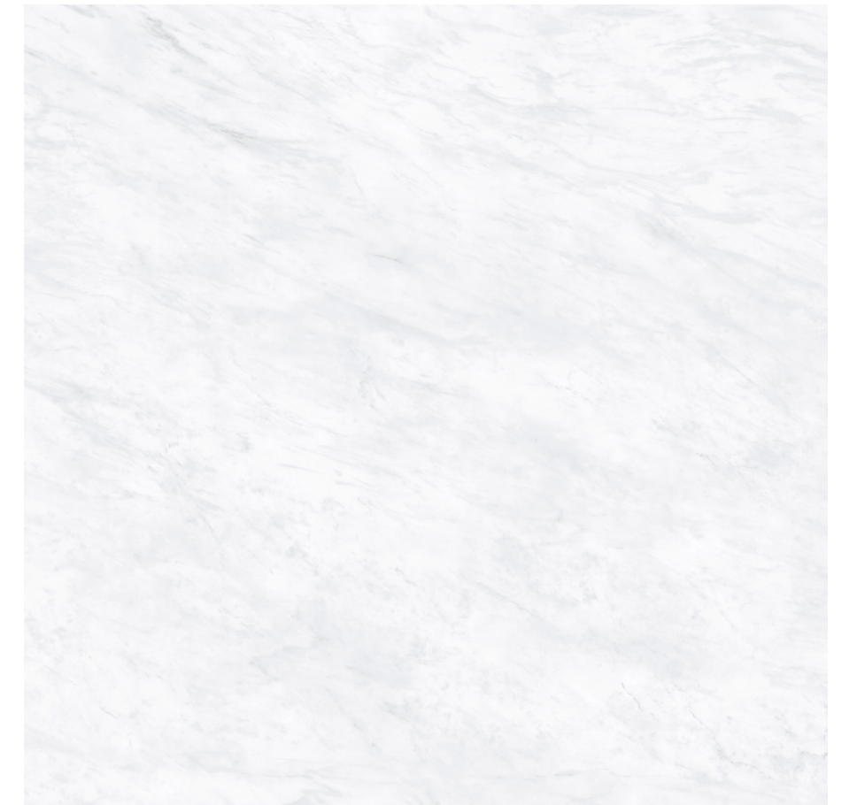
Galdana White Pul 120x120 R