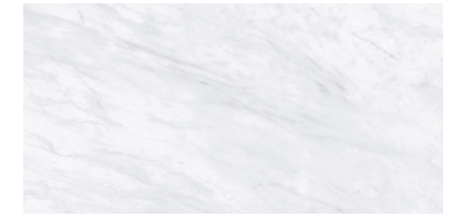
Galdana White 25x50 G1220