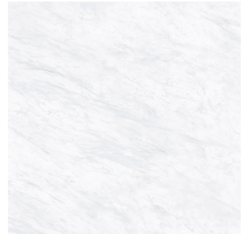
Galdana White Pul 100x100 R