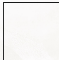
100x100 R 40"x40" R