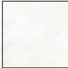
120x120 R 47¼"x47¼" R