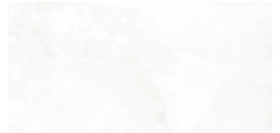
Berent White Pul 60x120 R