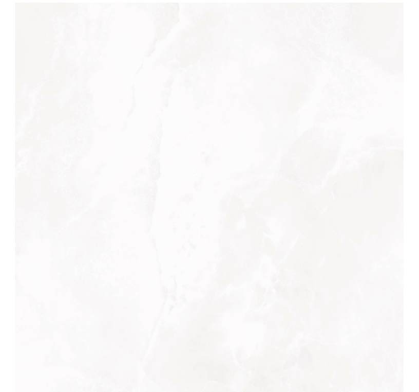
Berent White Pul 100x100 R