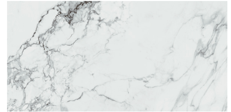
Capraia White Sat 60x120 R