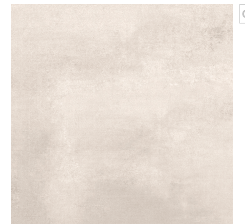
Zermatt Beige 60x60 R