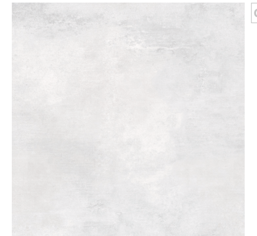
Zermatt White 60x60 R