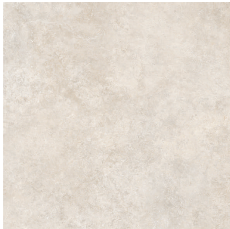
Tivoli Almond 100x100 R