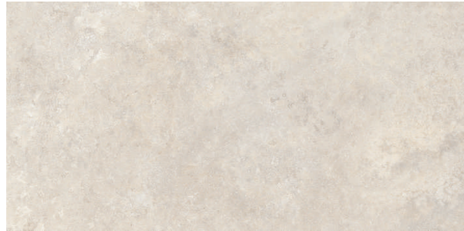
Tivoli Almond 60x120 R