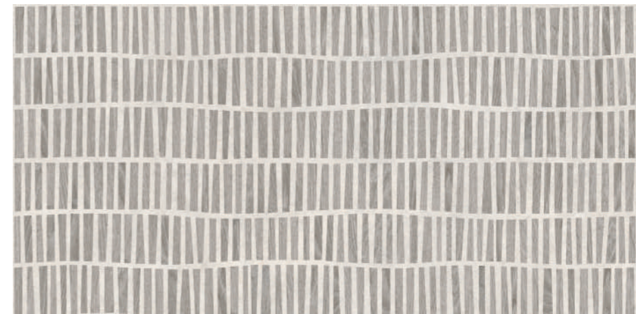
Dream Greige 60x120 R