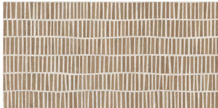
Dream Natural 60x120 R