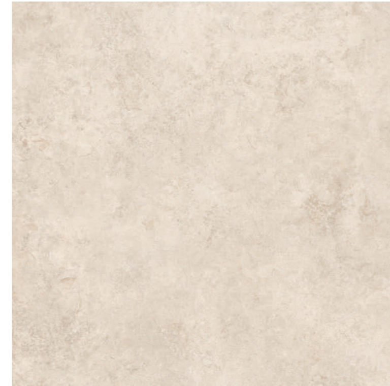
Tivoli Natural 100x100 R