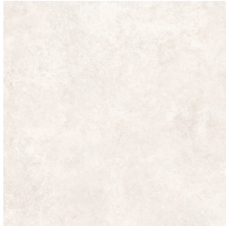
Tivoli White 100x100 R