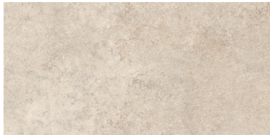
Tivoli Natural 60x120 R