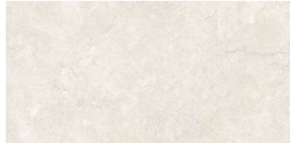
Tivoli White 60x120 R