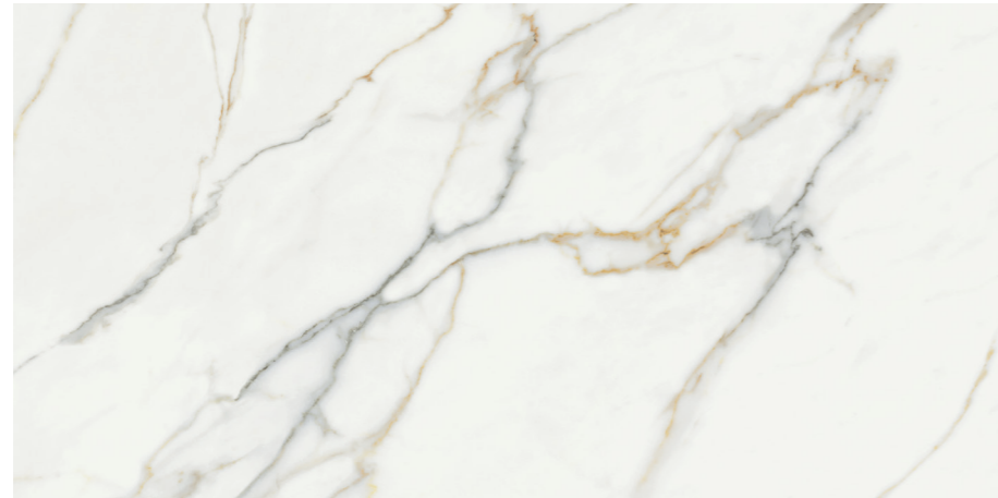
Aston Gold Sat. G461R