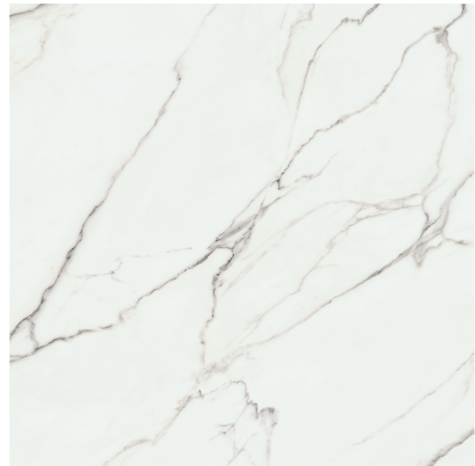
Aston White Sat. G443R