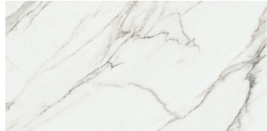
Aston White Sat. G461R