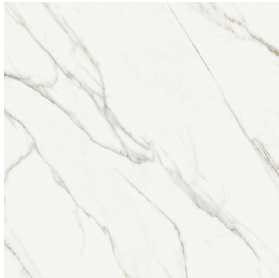
Aston Gold Sat. G443R