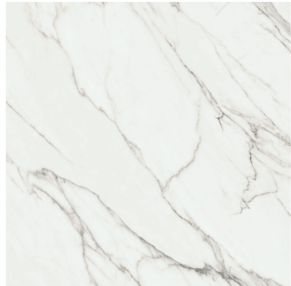
Aston White Pul. P440R