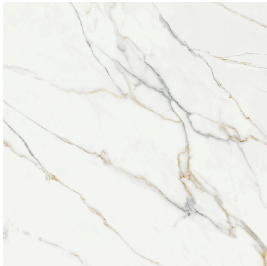
Aston Gold Pul. P440R